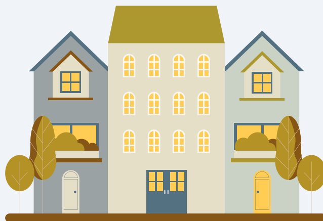
a terraced house